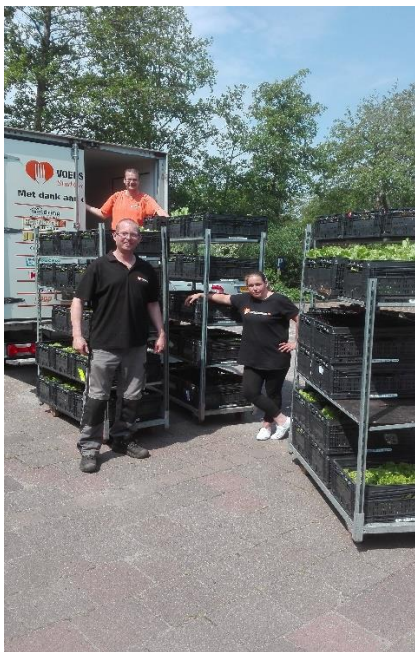
De oogst op weg naar de Voedselbank