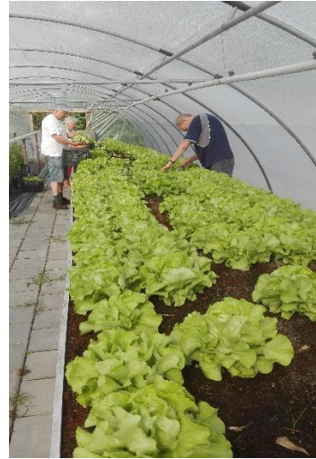
Van stek naar oogstproduct